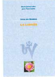
YOGA DE L'ÉNERGIE La Lignée