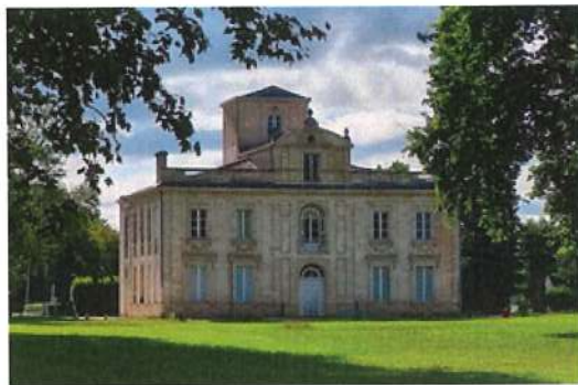
SHANTI, CERCLE DE YOGA D'ORBEC, EFYSO, AYEPI, AYEBSO