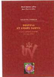
YOGA DE L'ÉNERGIE Souffle et corps subtil