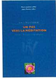
YOGA DE L'ÉNERGIE Un pas vers la méditation