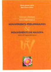
YOGA DE L'ÉNERGIE Mouvements Préliminaires et Mouvements de Naropa